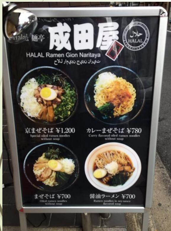
ハラールラーメン屋