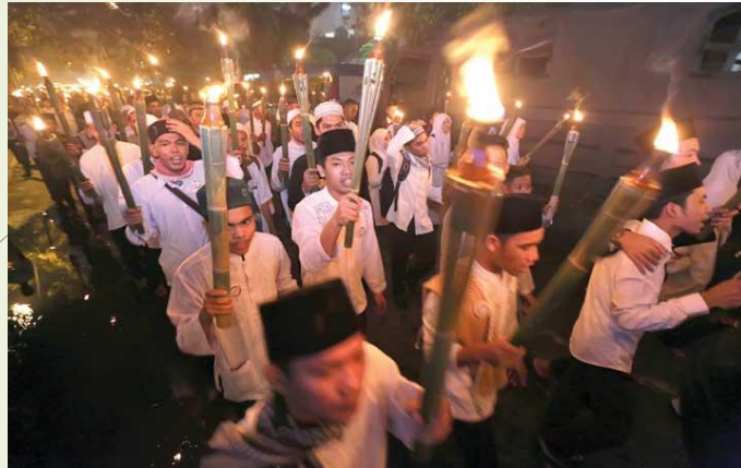
イスラム暦 (ヒジュリヤ年) のお正月