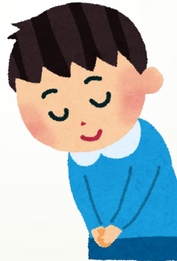
礼儀正しい・マナーを守る